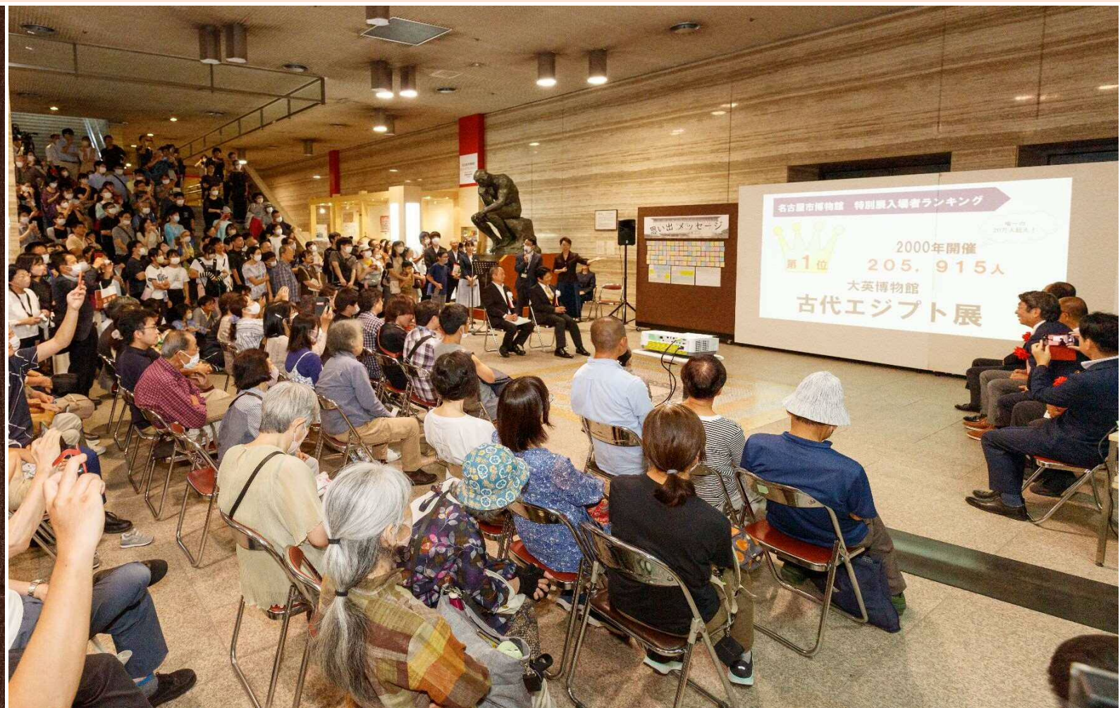
■2023年9月30日開催の休館セレモニー会場にて、掲示させていただきました。