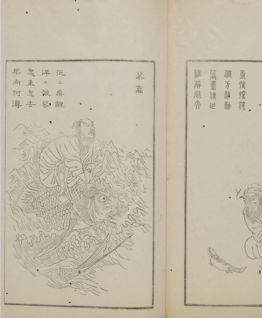
月僊『列仙図賛』天明4年(1784)刊 名古屋市博物館蔵

作品には次のような漢詩が入っています。 泛々乗鯉 洋々鼓琴 忽来忽去 果向何溽 ふわふわと鯉に乗って浮かび漂い美しく盛大に琴を打ち鳴らす突然姿を見せたかと思うとあつという間に消えてしまった果たして何処の岸に向かうのだろうか