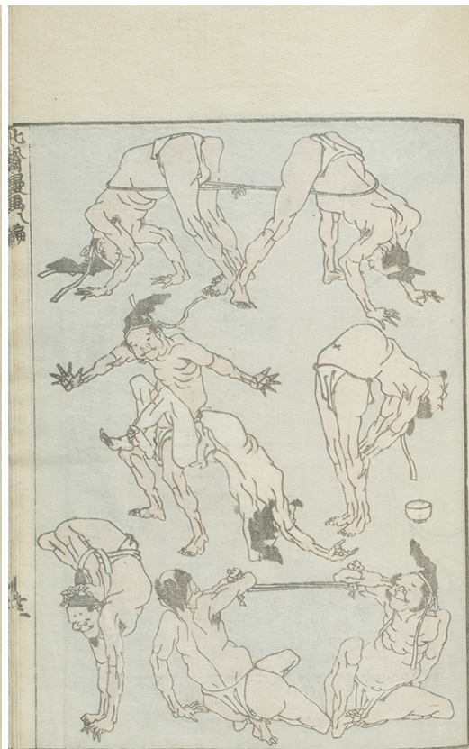
葛飾北斎『北斎漫画』七編 文化14年(1817)刊 名古屋市博物館蔵